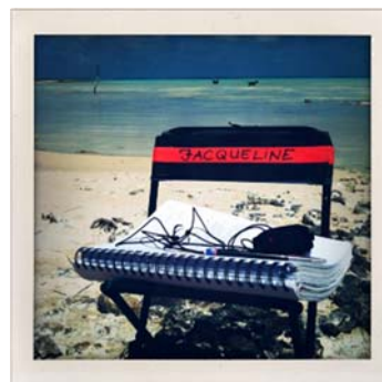
Outils de travail de Jacqueline Gamard sur le tournage de L'Ordre et la morale de Mathieu Kassovitz, 2010.