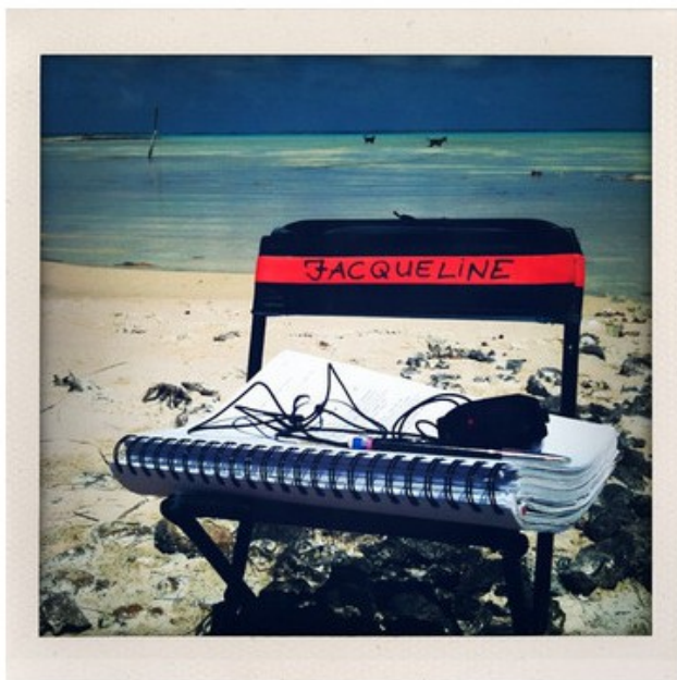
Outils de travail de Jacqueline Gamard sur le tournage de L'Ordre et la morale de Mathieu Kassovitz, 2010.